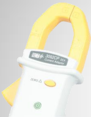
DC 전류 어댑터 (기본제공)

최신의 혁신적인 배터리 테스터로서 배터리 부동충전 중에도 배터리 셀의 전압, 내부 임피던스, 온도, 전류를 측정할 수 있 는 배터리 전용 측정기