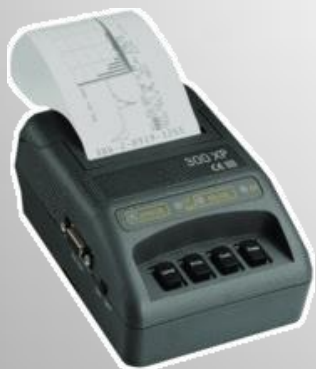
휴대형 소형 프린터 (옵션)